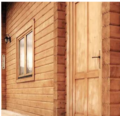
USI SI FERESTRE

Elementele balcoanelor și teraselor se construiesc din grinzi profilate de diferite grosimi astfel încât să se armonizeze cu structura casei.