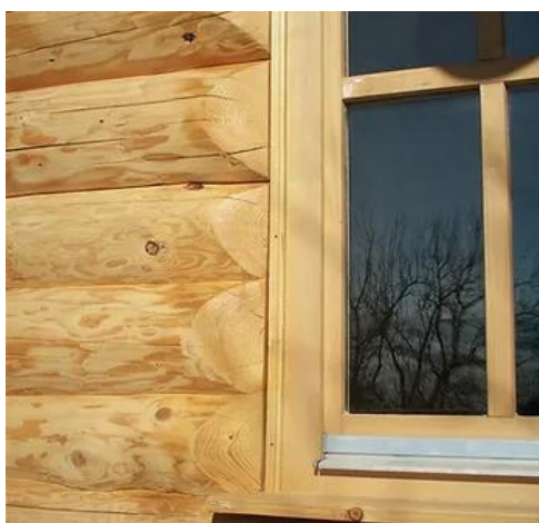
USI SI FERESTRE

Elementele balcoanelor și teraselor se construiesc din bușteni întregi de diferite diametre astfel încât să se armonizeze cu structura casei.